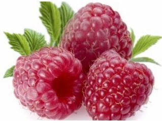
PURÉE DE FRAMBOISE BIO