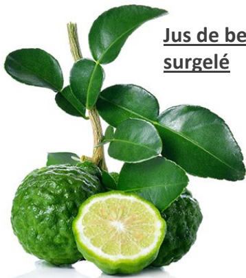
Jus de bergamotte surgelé