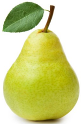
Poires cubes surgelées IQF IQF Frozen pears dices