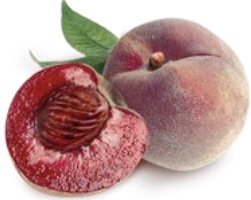
Pêches de vigne morceaux surgelées IQF IQF Frozen vine peaches pieces