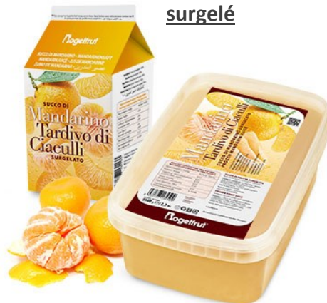
Jus de mandarine surgelé