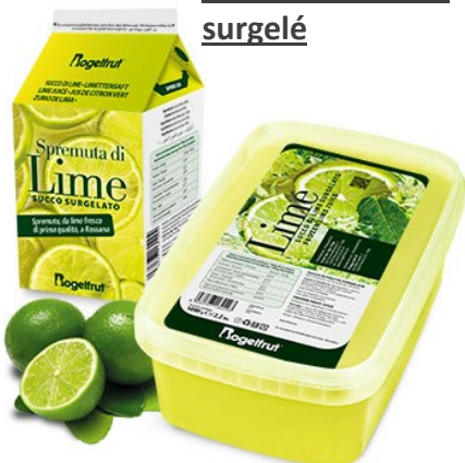
Jus de citron vert surgelé