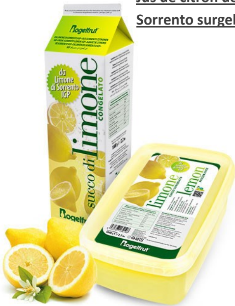
Jus de citron de Sorrento surgelé