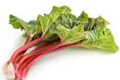
Rhubarbes rouges coupées surgelées IQF IQF Frozen rhubarb cuted