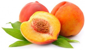
Pêches tranches surgelées IQF IQF Frozen peaches slices