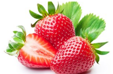
PURÉE DE FRAISE BIO