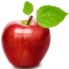
Pommes cubes surgelées IQF IQF Frozen apples dices