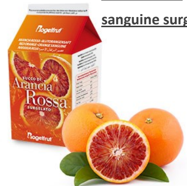
Jus d'orange sanguine surgelé