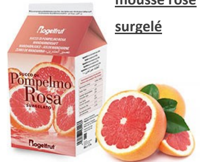
Jus de pamplemousse rose surgelé