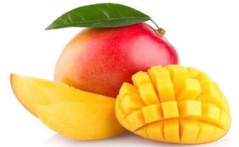
PURÉE DE MANGUE BIO