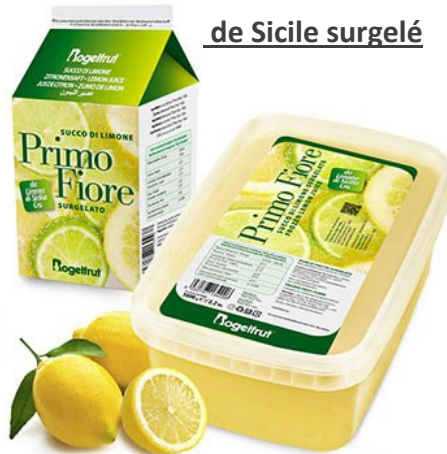
Jus de citron de Sicile surgelé