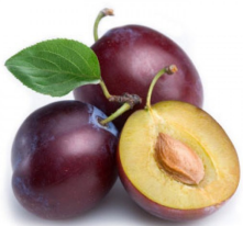
Prunes oreillons surgelées IQF IQF Frozen plum in halves