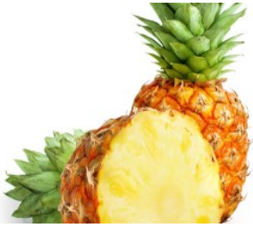
PURÉE D'ANANAS BIO