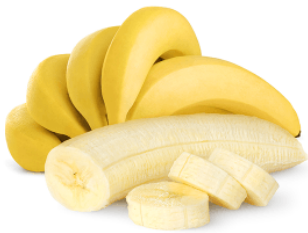
PURÉE DE BANANE BIO