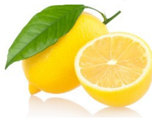
JUS DE CITRON DE SICILE BIO